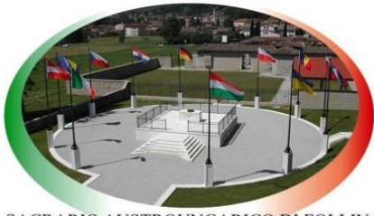
SACRARIO AUSTROUNGARICO DI FOLLINA "le bandiere dei Caduti non hanno colori"