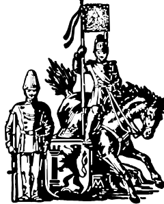
Markus Dangel Rittmeister und Kommandant Stadtgarde zu Pferd Saulgau e.V.

Wegen der Planung bitte Rückmeldung bis 08.06.2026 an Dirk Riegger, 0171/8707131 , ch-d.riegger@t-online.de oder Markus Dangel, 0160/4961698 , markusdangel18@gmail.com - Vielen Dank! -